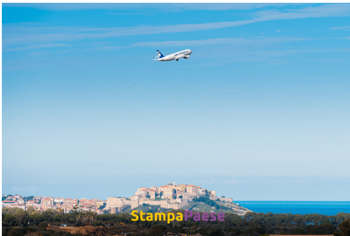
Calvi tend à s'ouvrir un peu plus vers l'Europe.

L'ensemble de ces investissements visant à améliorer la qualité de service proposée aux usagers mais aussi optimiser les conditions d'exploitation, a eu un impact positif en termes de ressources humaines, en effet, cela a permis de structurer nos services, d'internaliser de nombreuses compétences et de pérenniser des emplois. En complément de ces travaux, la CCI de Corse a lancé un Appel à Manifestation d'Intérêt ouvert à l'ensemble des compagnies aériennes nationales et européennes. Avec d'importantes mesures de soutien. Ce nouveau système permettra de favoriser la création de nouvelles liaisons et le développement des lignes existantes.