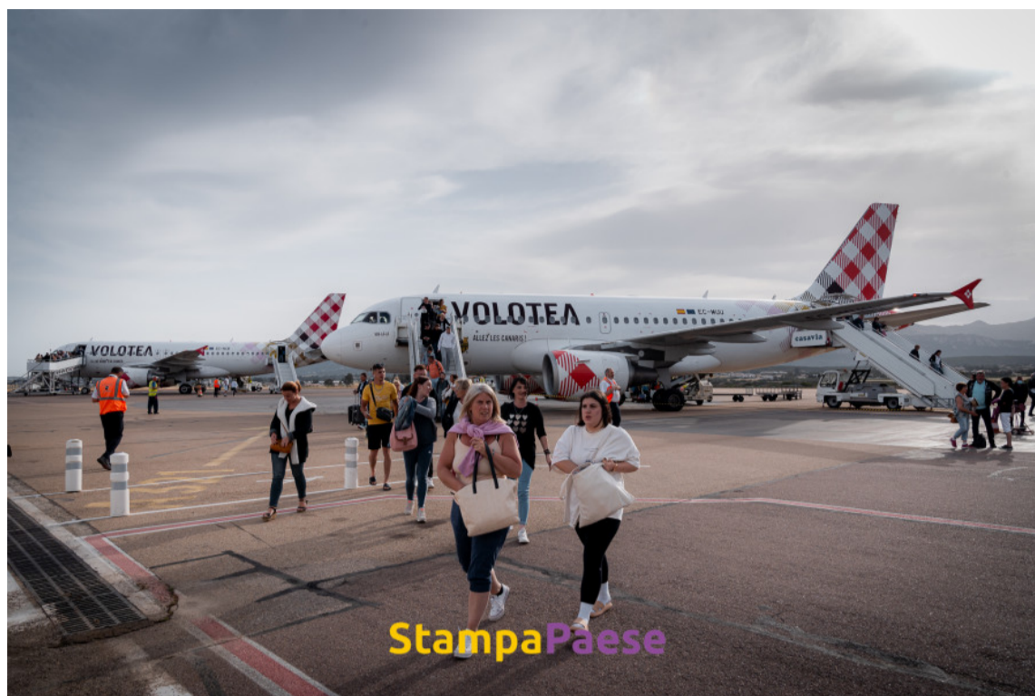
La ligne vers Bordeaux revient avec Volotea.

En collaboration étroite de la Collectivité de Corse ce n'est pas moins de 7 millions d'euros investis pour tendre vers un fonctionnement plus moderne, plus sûr et plus rationnel pour la plate-forme. « J'en profite pour remercier la CdC, qui nous fait confiance dans l'ensemble de nos chantiers et qui croit en l'avenir de notre plate-forme balanine. »